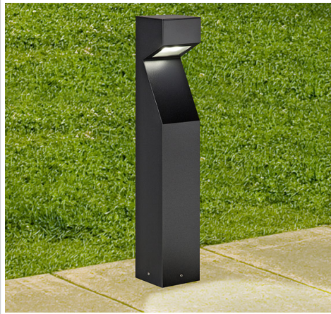
Thai - 1920