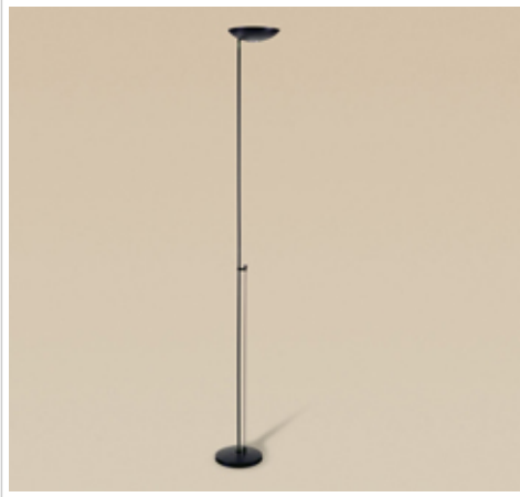
Huinca - 1442