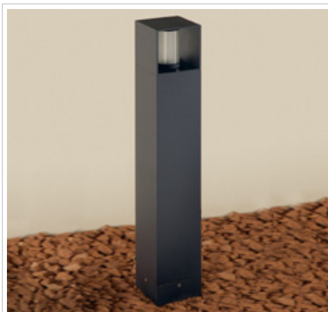
Boxer - 1831