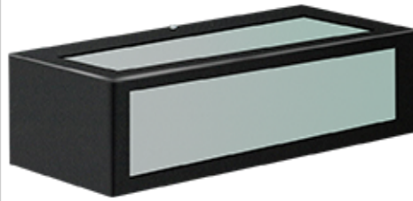
Block - 3128