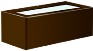
Block - 3125